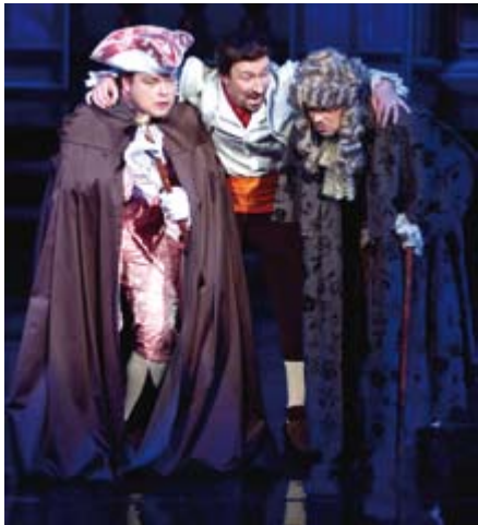
30 sierpnia zobaczyć będzie można „Wesele Figara” Mozarta.