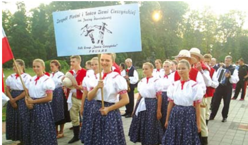
„Ziemia Cieszyńska” w korowodzie ulicznym

Zespoły zagraniczne kwaterowały w sympatycznym hotelu w pobliskiej miejscowości kuracyjnej Banja Koviljača. Tam też odbyły się dwa koncerty dla kuracjuszy, pośród których pojawiały się matki z chorymi dziećmi na wózkach - widok ściskający nam gardła.