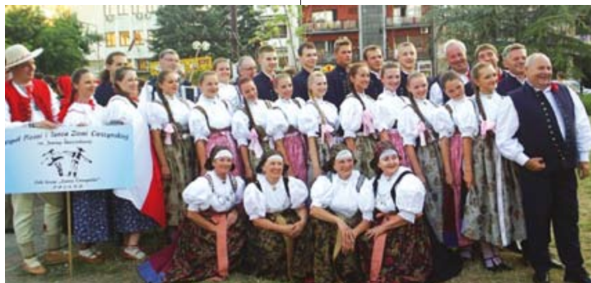
Grupowe zdjęcie

Główna arena festiwalowa była zlokalizowana w centrum Loźnicy, na szerokim deptaku.