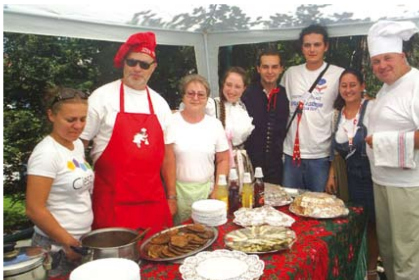
Placki z wyrzokami, cieszyńskie kołoczki, czy schabowy z kapustą cieszyły się wielkim powodzeniem