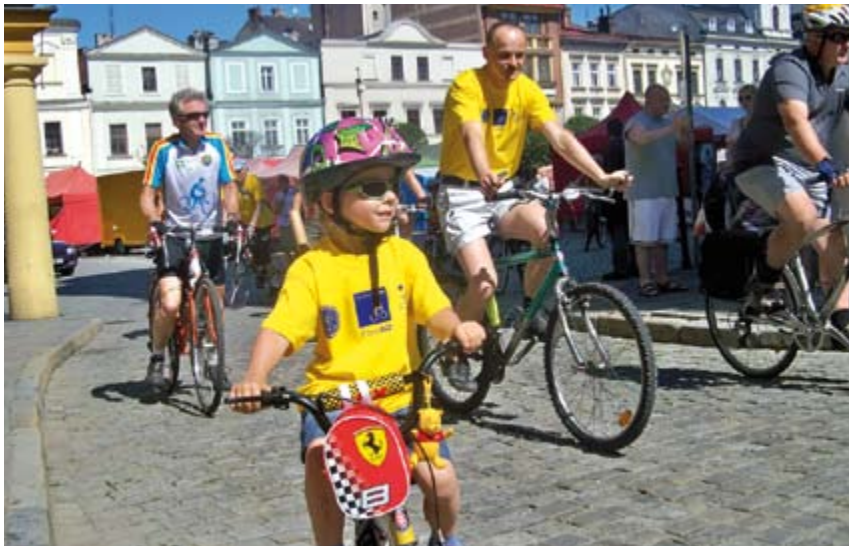
Ondraszek zaprasza na wycieczkę rowerową