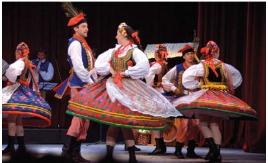
Turcja, Togo, Włochy, Rosja, Wenezuela, Argentyna, Chorwacja, Słowacja, Francja i Polska - zespoły z tych krajów zaprezentują się na Festiwalu w Cieszynie.

Międzynarodowy Studencki Festiwal Folklorystyczny, jako jedna z 300 światowych imprez folklorystycznych, od wielu lat ma stałe miejsce w kalendarzu CIOFF (Międzynarodowa Rada Organizatorów Festiwali Folkloru i Sztuki Tradycyjnej, działająca pod auspicjami UNESCO), ale jako jedyny przygotowywany jest przez środowisko akademickie.