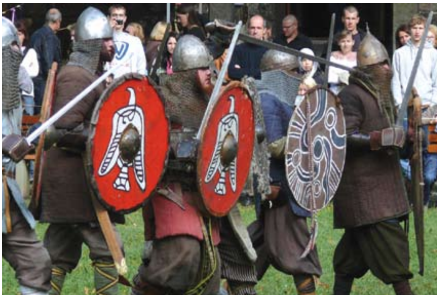
Na Wzgórzu Zamkowym mogliśmy oglądać średniowiecznych rycerzy