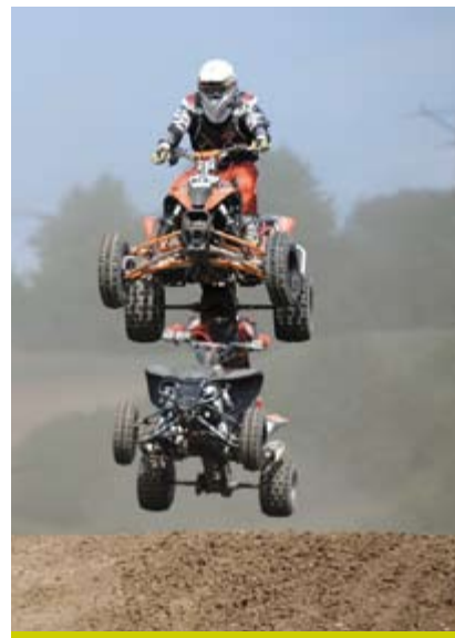
Wyścigi quadów