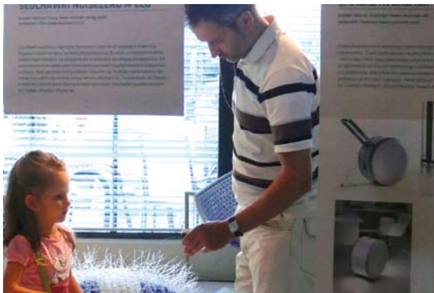
Na wernisażu pojawili się m.in. rodzice z dziećmi