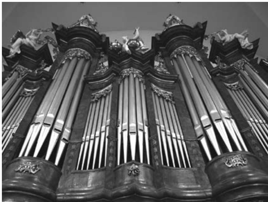
Organy kościoła Jezusowego potrzebują kapitalnego remontu